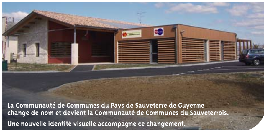
La Communauté de Communes du Pays de Sauveterre de Guyenne change de nom et devient la Communauté de Communes du Sauveterrois. Une nouvelle identité visuelle accompagne ce changement.